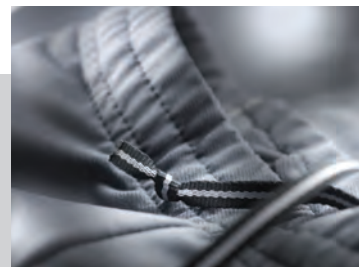
Dual elastic waistband for comfort fit

Decorators access: Open Decoration process: Transfer print, embroidery