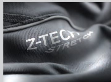
Z-TECH® stretch logo on left thigh in reflective material